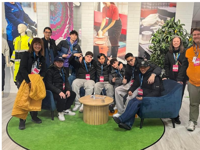
kuva 2. Opiskelijaryhmä opettajineen.

Lindströmin vierailu alkoi yritysesittelyllä, jossa opiskelijat saivat perustietoa yrityksestä ja katsauksen siihen, miten ICT-ratkaisuja hyödynnetään eri vaiheissa – suunnittelusta logistiikkaan ja tuotteiden elinkaaren hallintaan. Keskustelussa korostui myös ICT-osaamisen kasvava rooli perinteisten teollisuusprosessien rinnalla. Yritysesittelyn jälkeen ryhmä pääsi tutustumiskierrokselle tuotantotiloihin. Opiskelijat näkivät läheltä, miten tekstiilit kulkevat pesusta lajitteluun, korjaukseen ja uudelleenjakeeluun automatisoidun ja ohjatun prosessin mukaisesti. He pääsivät seuraamaan, miten manuaalinen työ ja moderni teknologia yhdistyvät kokonaisuudeksi. Erityisen kiinnostavaa oli farmasiateollisuuden työvaatteiden hygieeninen käsittely ja RFID-teknologian käyttö tekstilien seurannassa sekä se, miten dataa kerätään ja analysoidaan tuotannon tehostamiseksi ja palvelun laadun varmistamiseksi.