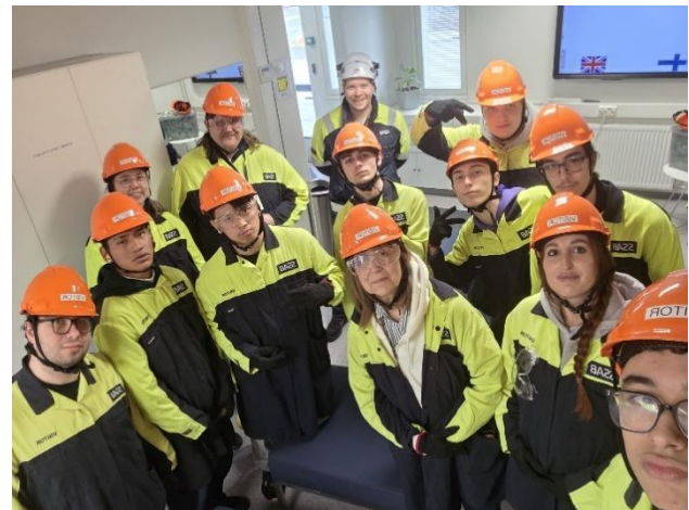
kuva 6. Opiskelijaryhmä opettajineen.

Yrityksen tietotekniikka ja digitaaliset palvelut tukevat tuotantoa merkittävästi. SSAB:n IT-toiminnan painopisteitä ovat joustava etättyö (mm. Citrix-ratkaisut), tehokas projektihallinta (Microsoft Project for the Web), moderni raportointi (Power BI) sekä turvalliset ja yhtenäiset pilvipalvelut. IT:n rooli on keskeinen erityisesti siinä, että kriittiset järjestelmät pysyvät toimintakunnossa vuorokauden ympäri. Vierailu tarjosi opiskelijoille ainutlaatuisen mahdollisuuden tutustua suomalaisen huipputason teollisuuden arkeen, teknologiaan ja uramahdollisuuksiin. Suuryrityksellä on monet työllistämisen mahdollisuudet ja polku työelämään voi hyvinkin käynnistyä harjoittelujaksosta.