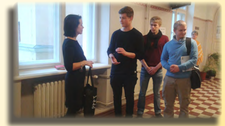
Kuvassa oppaалlemme annetaan pieni tulinainen Suomesta.